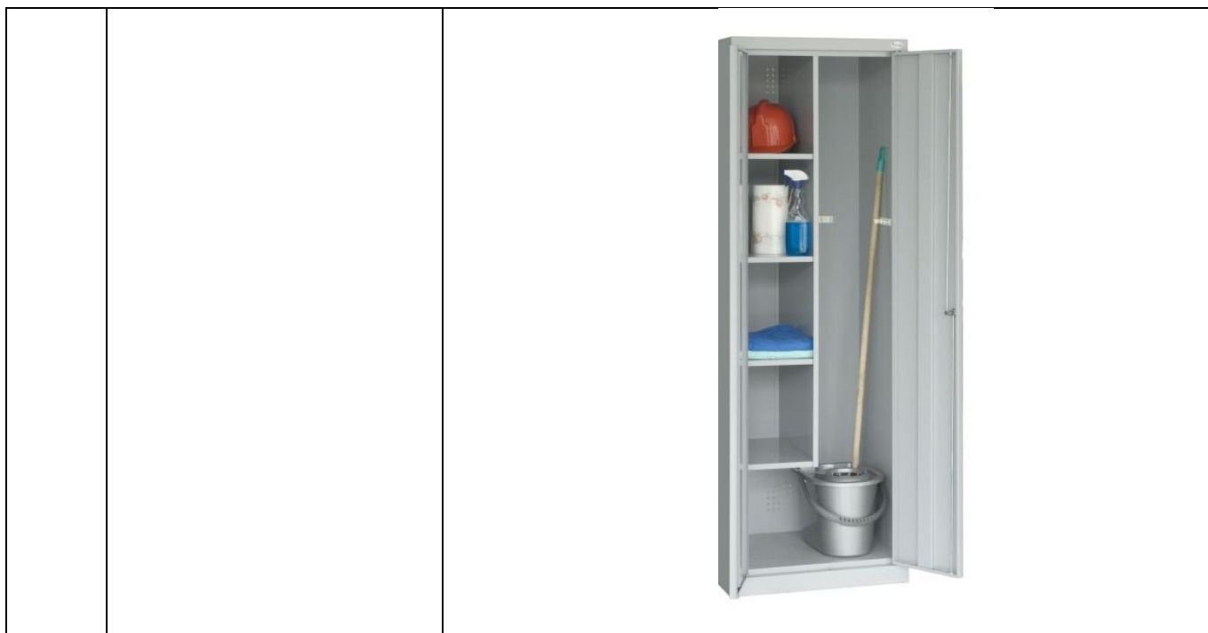
1.2. lentelė. ADRESAI, KURIUOSE REIKALINGOS SPINTOS IR ATSAKINGI ASMENYS